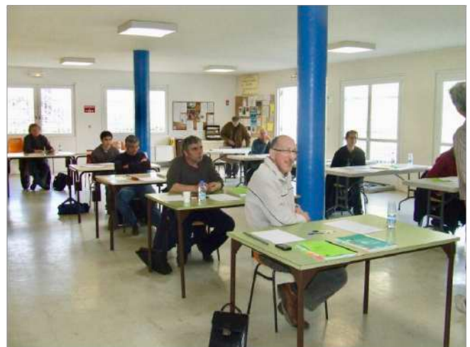
Examen d'arbitrage 2011

l'aventure, dans un premier temps pour rendre service au club, mais, dès le premier stage de formation, j'ai été convaincu du bonus que représente le fait d'être