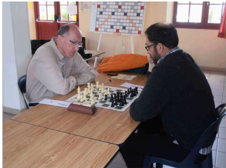
Tournoi interne 2011-2012

Je fais monter sur le podium trois anciens Champions du Monde soviétiques. Mikhail Tal est devenu en 1960 le plus jeune Champion du Monde, à l'âge de vingt-quatre ans. Doté d'un talent hors du commun pour les combinaisons, il n'avait pas son pareil pour mettre le feu à l'échiquier en amenant des positions où personne n'était sûr de trouver la bonne suite, mais lui, il savait par intuition et par expérience qu'il avait moins de chances de perdre le fil que ses adversaires.