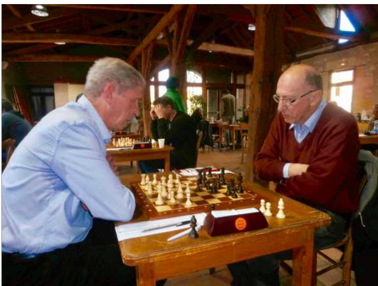
Interclubs janvier 2014

Enfin, je ne vous surprendrai pas en citant également Gary Kasparov , qui est devenu Champion du Monde en 1985 à vingt-deux ans en battant le record de précocité établi par Tal. Je dirai simplement de Kasparov, qu'on ne présente plus, qu'il est le chantre d'un jeu dynamique, n'hésitant pas à sacrifier pour avoir l'initiative dans la partie.