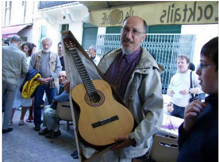
Open La Croche Villeneuve-sur-Lot 2009

Je me souvins d'un autre conseil d'Alain : peu importe le nombre de pions, ce qui compte c'est l'activité des pièces. Je m'appliquai de mon mieux, mais mon adversaire, conscient de son avantage, n'entendait pas relâcher la pression. Je pris conscience que l'heure avait tourné quand j'entendis les premières clameurs monter du stade. C'était le coup d'envoi. Je réalisai que ce soir là, je n'irais pas au stade... À la fin, je n'avais pas tout perdu, puisque mon adversaire se résigna à la nulle au 67 ème coup.