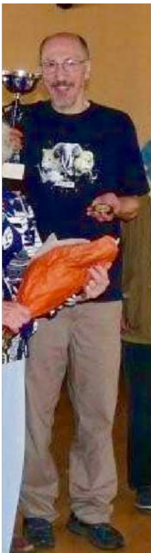
Championnat Vétérans Arcachon 2009